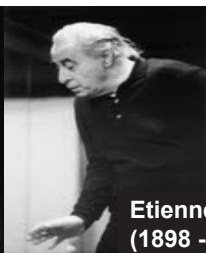
Etienne Decroux (1898 - 1991)